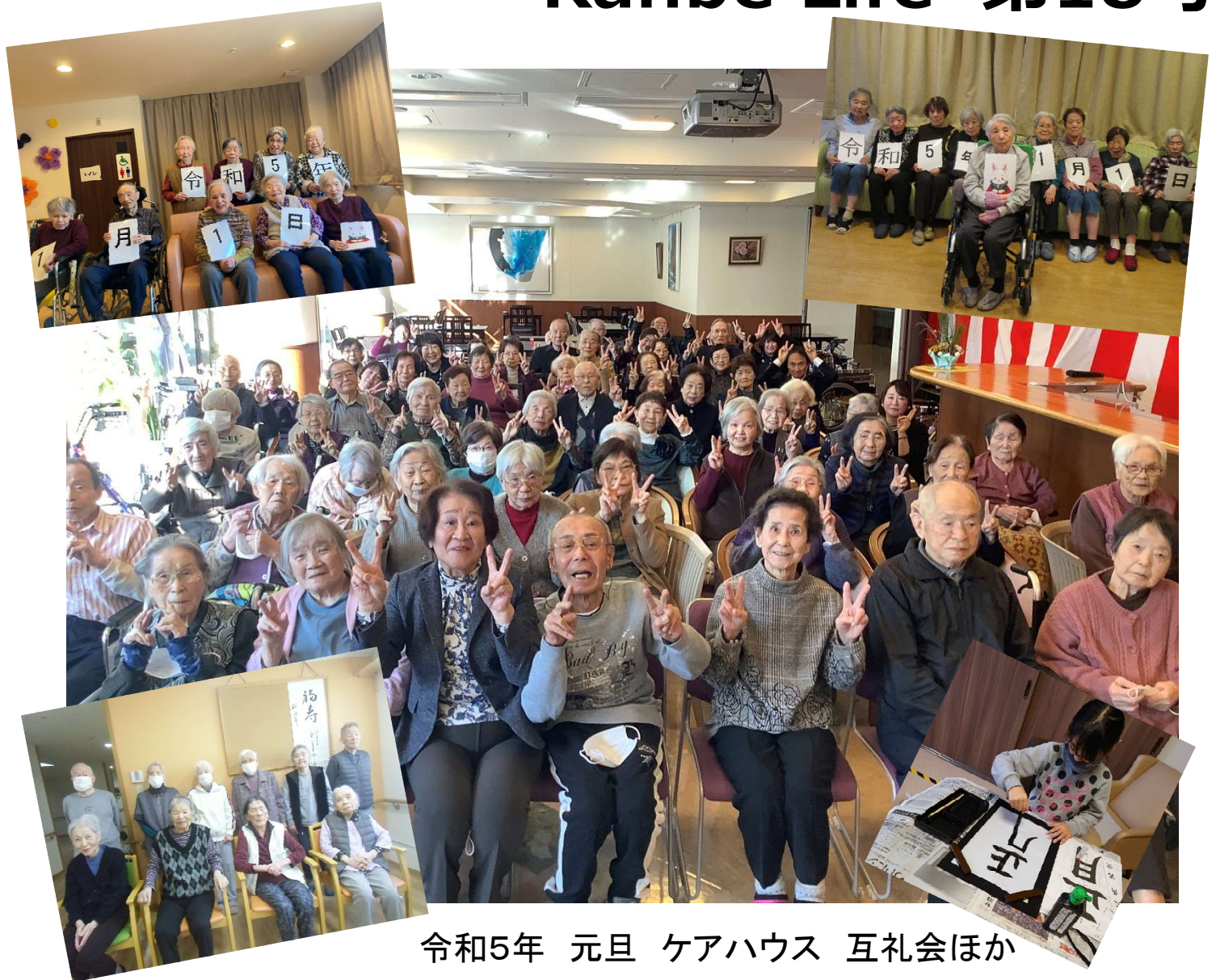
令和5年 元旦 ケアハウス 互礼会ほか

令和5年1月1日、冬晴れのおだやかな年の始まりでした。どうぞ、この天気のようにおだやかに、そして平和な1年でありますように祈りました。