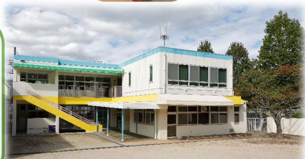
多機能型事業所かんべ三入東事業所